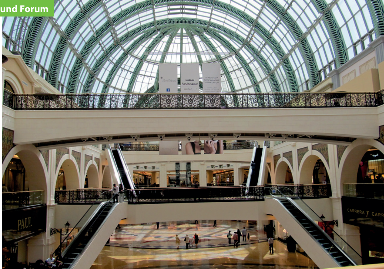
Mit einer Fläche von 223 000 Quadratmetern zählt die Mall of the Emirates in Dubai zu den größten Shopping-Malls der Welt.

mat“ bezeichnet. Betriebsformen ermöglichen eine Grobstrukturierung des Handels anhand wichtiger Kriterien wie Größe, Verkaufsfläche, Bedienungsprinzipien, Sortimentstiefe oder -breite. Die Ausprägungen dazu sind dann Fachhandel, Warenhäuser, Versender, Discounter, SB-Warenhäuser und einige mehr. Als Betriebstyp bezeichnet man Differenzierungen einzelner Betriebsformen; so ist etwa ein Wäsche-Spezialgeschäft ein Betriebstyp der Betriebsform Fachhandel. Das Format ist dann die konkrete Beschreibung einer unternehmensspezifischen Form eines solchen Wäsche-geschäftes, wie z. B. das Format von „Hunckemöller“, von „Victorias Secret“ und wie sie alle heißen mögen. Mit Format bezeichnet man also die konkrete Beschreibung eines direkten,