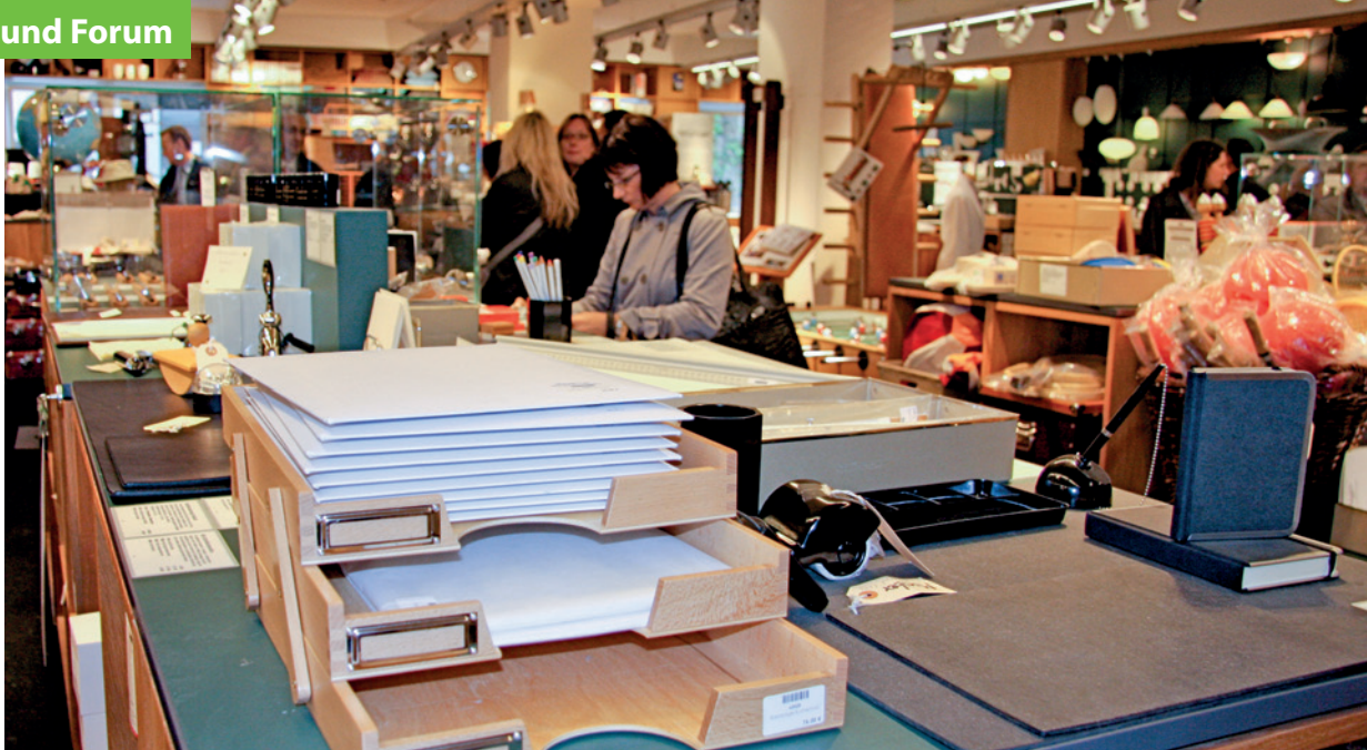
Multi-Channel-Marketing: Die Manufactum Warenhäuser sind ein Beispiel für gelungenen Erlebniskauf.

mationsanbahnung, Gewinnung zusätzlicher Informationen und letztlich auch des Bestellens und des Bezahlens. Near Field Communication (NFC) unterstützt vor allen Dingen im stationären Handel den Einsatz der Smartphones. Im stationären Handel kommen auch Technologien wie Digital Signage dazu – also die Möglichkeit, mithilfe von bildgebenden Technologien die Warenpräsentation in den Läden völlig anders aufzuziehen.