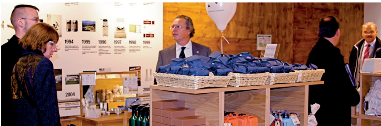
PBS-Händler informieren sich während einer BBW-Tagung in Köln bei Muji. Das Motto der Ladenkette: Kein Brand ist auch ein Brand. Das japanische Unternehmen verspricht den Kunden aber eine hohe Qualität der Produkte.

Die Menschen werden immer älter und sie haben immer weniger Lust, mit ihrem Auto auf die Grüne Wiese zu SB-Warenhäusern zu fahren. Es fehlen Geschäftsformate, die auf-